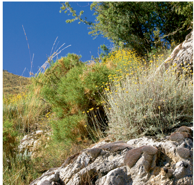
5 Naturstandort in der Sierra Nevada

Die Sortimente der Staudengärtnereien entstammen den Landschaften Europas, den Gebirgen des Mittelmeerraumes sowie vielen klimatisch vergleichbaren Naturräumen und Standorten in Asien, Nord- und zu geringem Anteil auch Süd-Amerikas. Einige, überwiegend alpine Arten aus Neuseeland sind ebenfalls ausreichend winterhart. Vom Naturstandort, an dem sie sich unter oft härtesten Bedingungen unter Stress und Konkurrenz behaupten müssen, bringen Pflanzen ihren Charakter mit.