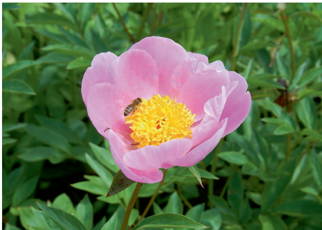
4 Langlebige Pfingstrose Paeonia lactiflora „Nympe“

Auf der anderen Seite der Skala stehen Dauergewächse wie die Pfingstrosen ( Paeonia ) oder einige Farne, z. B. der Schildfarn ( Polystichum ), die unbeschränkt, also viele Jahrzehnte alt werden und sich dabei weiterentwickeln. Der Preis dafür ist meist eine mehr oder weniger lange Entwicklungsdauer nach der Pflanzung bis zum funktionsfähigen Zustand, ähnlich wie bei den Gehölzen. Die meisten Stauden stehen zwischen diesen Extremen. Am passenden Standort entwickeln sie sich im ersten oder zweiten Jahr nach der Pflanzung bereits zum Optimum und überdauern, solange es genug Raum gibt, ebenfalls viele Jahre, nachweislich sogar Jahrzehnte.