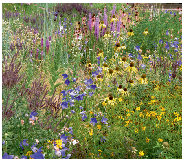
2 Eine reife Pflanzung

Stauden entwickeln sich schnell. Je nach Art bilden sich viele Blütenstauden, etliche Gräser oder manche Farne binnen Jahresfrist, auf jeden Fall nach wenigen Jahren. Bei fachgerechter Mindestpflege wirken Staudenflächen über viele Jahre und sie reifen mit den Jahren und können dabei zunehmend schöner werden, nicht anders als Gehölzpflanzungen, nur eben sehr viel schneller. Kein Jahr ist gleich, stets wandelt sich das Bild, abhängig von Standort, Witterung, Alter und Pflegezustand: Stauden stehen für lebendige Gärten, zeigen die Dynamik der Jahreszeiten und sind Leben pur!