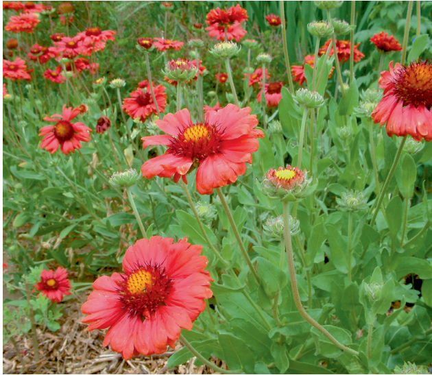
3 Kurzlebige Gaillardia grandiflora „Burgunder“

reopsis), sowie intensiv rot blühende Kokardenblumen. Das Ergebnis der Kreuzung langlebiger Gaillardia aristata mit der annuellen Gaillardia pulchella nennt sich Gaillardia x grandiflora und blüht über Monate in starken Farben, der Preis für die langanhaltende Pracht ist relative Kurzlebigkeit.