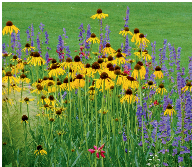
1 Eine junge Pflanzung

Ob der Mensch sich wohlfühlt, einen Ort interessant findet und sich dort gerne aufhält, hängt stark von seiner persönlichen Befindlichkeit, seiner Stimmung, gar spontanen Emotionen ab. Ort und Befindlichkeit korrelieren oft stärker als rational erklärbar ist. Intuitiv spürt man „Hier will ich sein“ – oder eben nicht. In ganz besonderer Weise sind Pflanzen in der Lage die Stimmung an einem Ort positiv zu beeinflussen, denn der Pflanzenbestand in seiner Lebendigkeit prägt einen Ort entscheidend mit. Ob eine Anpflanzung opulent oder karg ausgeführt ist oder völlig fehlt: Pflanzen haben immer eine starke Wirkung! Sogar wenn sie fehlen. Warum darauf verzichten? Gehölze in ihrer führenden Funktion sind dagegen langsam in ihrer Entwicklung. Der gewünschte Effekt, technisch ausgedrückt der „funktionsfähige Zustand“, z. B. eines frisch gepflanzten Großbaumes, liegt noch weit in der Zukunft.