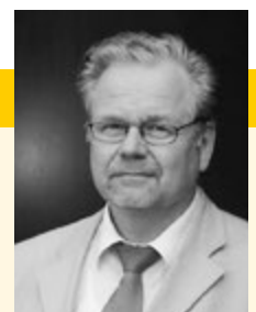
Herausgegeben von Franz-Josef Drees Referent für Zoll- und Exportverfahrensfragen, Exportconsultant und Seminarleiter

Eine interessante Lektüre wünscht Ihnen Franz-Josef Drees