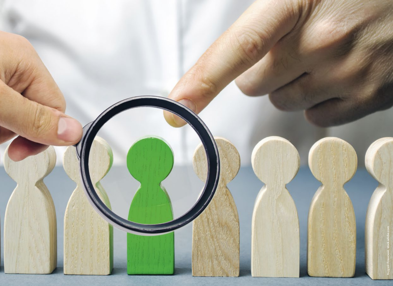
Manchmal finden Pflegeeinrichtungen den geeigneten Kandidaten im eigenen Team

nicht nur in einem Ausschreibungsprozess langfristig von gewonnenen Kontakten profitiert werden. Aktiv für die Einrichtung zu werben und dieses auf Veranstaltungen zu repräsentieren kann zudem zu einer Prestige-steigerung beitragen. Auch kann das Interesse von Praktikanten und Pflegeschülern geweckt und diese für die Berufsgruppe begeistert werden.