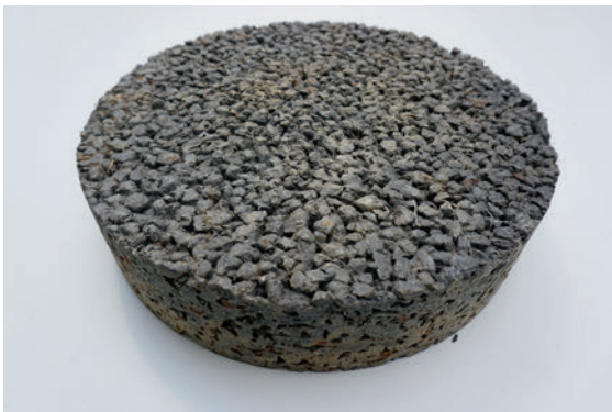
Abb. 5.4.2.2-2: Probekörper Dränbetondecke DBD 5/8