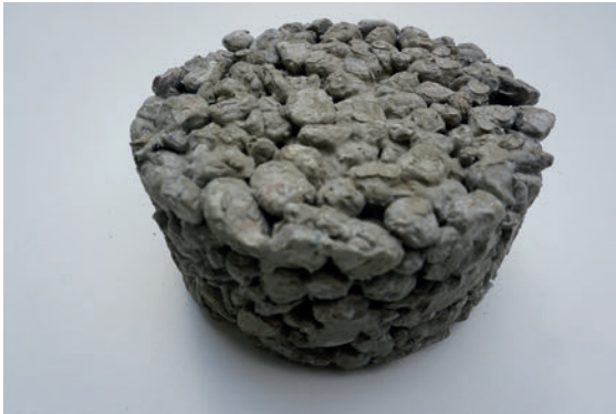
Abb. 5.4.2.2-1: Probekörper Dränbetontragschicht DBT 8/16

Man unterscheidet: Dränbeton für Tragschichten (DBT) und für Fahrbahndecken (DBD) die im Verkehrswegebau zur Herstellung versickerungsfähiger Verkehrsflächen verwendet werden.