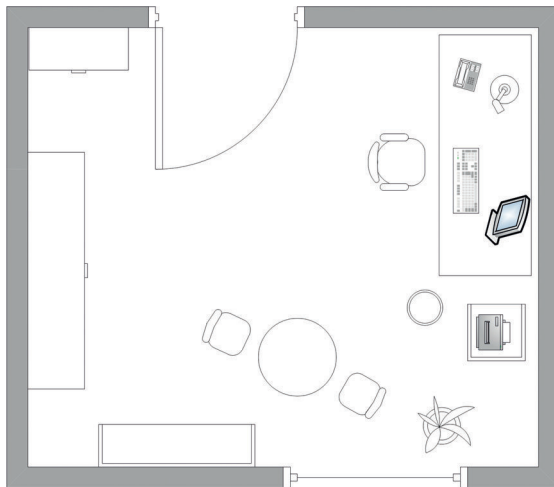
Abb 2.3.2.1.1: Musterplan Büro

Bei Beschreibung der einzelnen Reinigungstätigkeiten müssen alle Einrichtungsgegenstände in einem Raum berücksichtigt werden. Da z. B. Büroräume die gleiche Ausstattung haben, aber die Nutzer sich unterschiedlich verhalten, sind Regelungen zu definieren, wann bestimmte Bereiche gereinigt werden sollen.