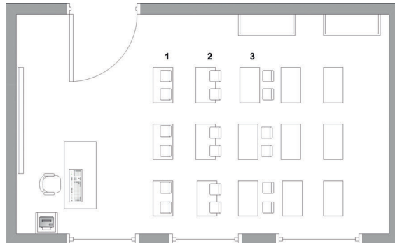
Abb 2.3.2.1.2: Musterplan Klassenzimmer

Da in einem Klassenraum 20–30 Schüler sitzen, erfordert jeder Handgriff Zeit, die bei der Leistungsberechnung berücksichtigt werden muss. Nur wenn genau definiert ist, was wann wie oft gereinigt wird, kann die Arbeitszeit genau errechnet werden.