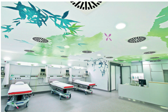
Abb. 8.4.1-2: Uwe Schäfer, Rhabarber, Ruheraum Ambulantes Operieren, 2008

Daneben werden auch Wartebereiche oder lange Flure gestaltet. Hier geht es eher darum, dem Betrachter mit farblichen und motivischen Gestaltungen das Warten zu erleichtern sowie den Weg optisch abwechslungsreich im Sinne von Orientierungspunkten zu gestalten. Patienten, Besucher und Mitarbeiter können so quasi im Vorübergehen die Möglichkeit erhalten, etwas Abstand zum Krankenhausalltag zu gewinnen.