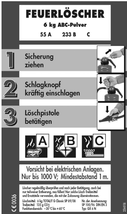
Bild 2: Beispiel einer Kennzeichnung auf einem Feuerlöscher