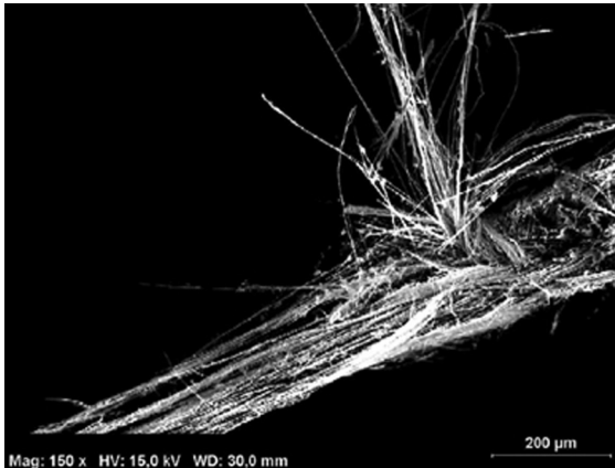
Abb. 3.3.1-1: Mikroskopische Aufnahme einer Asbestfaser