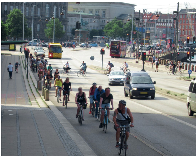
Bild 1: Ziel der Netzplanung ist die systematische und flächenhafte fahradfreundliche Erschließung einer Kommune

Der Begriff „Netzplanung“ umfasst einerseits die Planung des Radverkehrsnetzes und andererseits die erfolgreiche Realisierung durch die Erarbeitung von Einzelmaßnahmen zur sicheren und fahradfreundlichen Gestaltung des Radverkehrsnetzes.