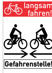
Bild 14: Hinweistafel Gefahrenstelle

Auf Schwachstellen sollte in Form von Hinweistafeln entsprechend hingewiesen werden. So können z. B. schlecht einsehbare Bereiche, die im Zweirichtungsverkehr befahren werden, mit folgendem Hinweistafel ausgeschildert werden.