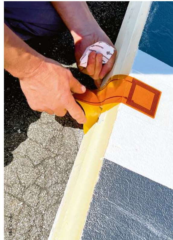
2 | Die Feuchtesensoren werden so eingebaut, dass sie unter der Wärmedämmung auf der Dampfsperre bzw. dem Altdach liegen.

Dazu wurde nach dem Abriss der alten Dachrinnen am Dachrand eine Traufbohle 30/150 auf der alten Dachabdichtung fixiert. Im Abstand von 45 cm dahinter erfolgte die Montage einer zweiteiligen Holzbohle mit insgesamt 16 cm Höhe als