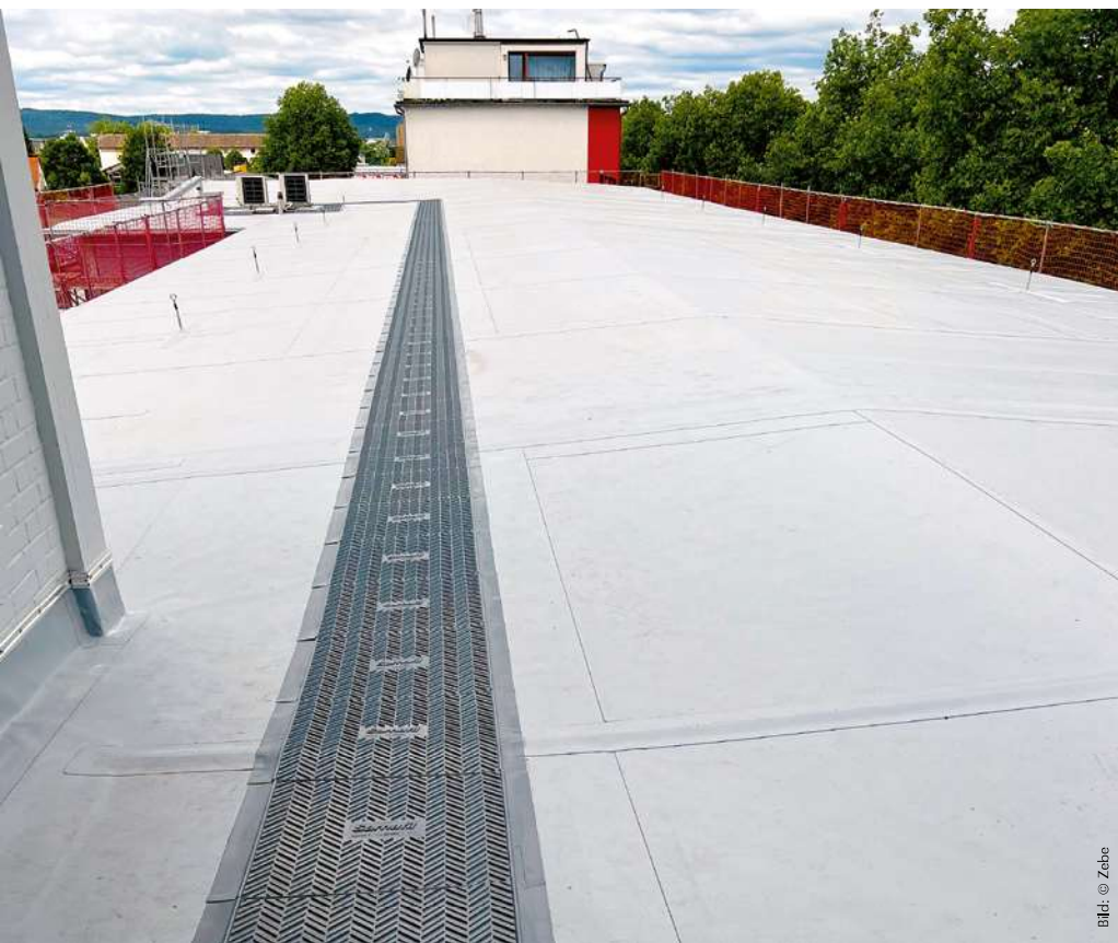
6 | Nach der Dichtigkeitsprüfung konnte die überarbeitete Dachfläche mängelfrei abgenommen werden.

schwankung an und meldet gleichzeitig die Leckage mit einem akustischen und visuellen Ortungssignal.