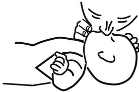
Bild 3: Legen Sie Ihre Lippen zur Beatmung dicht um Mund und Nase des Säuglings.