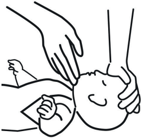
Bild 1: Kopf nur leicht überstrecken.