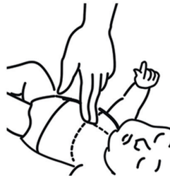
Bild 4: Abwechselnd 30 x drücken mit zwei Fingern, 2 Atemspenden.