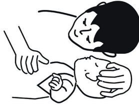
Bild 2: Führen Sie eine Atemkontrolle durch.