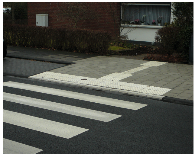
Bild 13: Überquerungsstelle mit einheitlicher Bordhöhe (3 cm)

Eine alternative, barrierefreie Lösung zur differenzierten Bordhöhen stellt eine Überquerungsstelle mit einheitlicher Bordhöhe dar (Bild 13). Bei dieser Ausführungsform nutzen alle Fußgänger unabhängig von einer möglichen Behinderung eine gemeinsame Überquerungsstelle. Diese Bauform ist gegenüber der differenzierten Bordhöhe kompakter, baulich einfacher zu realisieren und damit kostengünstiger. Sie bietet weiterhin Vorteile bei der Entwässerung, da die Wasserführung am Bord nicht durch eine Nullabsenkung unterbrochen wird. Zudem lässt sich diese Form der Überquerungsstelle auch bei geringer Flächenverfügbarkeit realisieren.