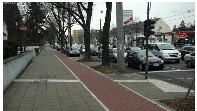
Bild 14: Auffindestreifen (hier an einer Überquerungsstelle) sind im Bereich eines Radwegs zu unterbrechen. (Quelle: Boenke)

Die Montage des Tasters in einer Höhe von ca. 85 cm über der Gehwegoberfläche sorgt für eine gute Erreichbarkeit für alle Nutzer. Eine Farbgestaltung mit deutlichem Leuchtdichtekontrast gegenüber dem Mast erleichtert die Auffindbarkeit für sehbehinderte Menschen.