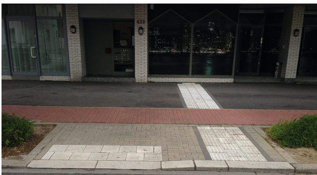
Bild 11: Überquerungsstelle mit differenzierter Bordhöhe (hier mit Sonderbordstein)

Der abgesenkte Überquerungsbereich liegt dabei üblicherweise auf der jeweils kreuzungszugewandten Sei-